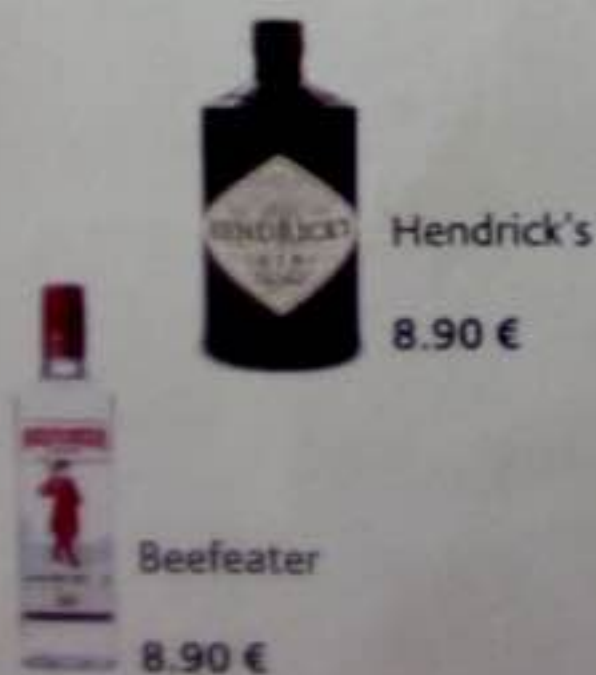
Hendrick's 8.90 €