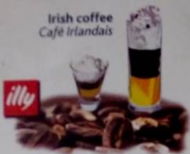
Irish coffee Café Irlandais