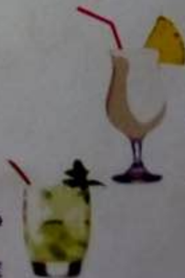
Piña Colada 8.50 €